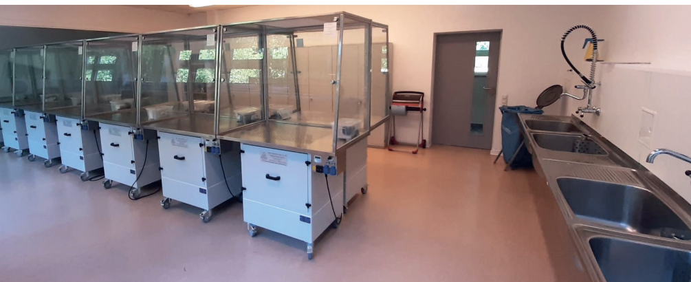
Laborraum für die Spurensicherung, in dem sich 14 Arbeitstische mit Feinstaubabsaugung sowie Doppelmehrzweckbecken mit Spülbrausegaritur befinden.

„Idealerweise war der zuständige Fachbereich VI in die Planungs- und Bauphase mit einbezogen worden. So sind im Rahmen des Möglichen fast alle Wünsche berücksichtigt worden. Die Fachlehrerinnen und Fachlehrer durften beispielsweise die Waschbecken, Armaturen, Möbel und Lampen selbst aussuchen“, war Jan Hagemann voll des Lobes. ■